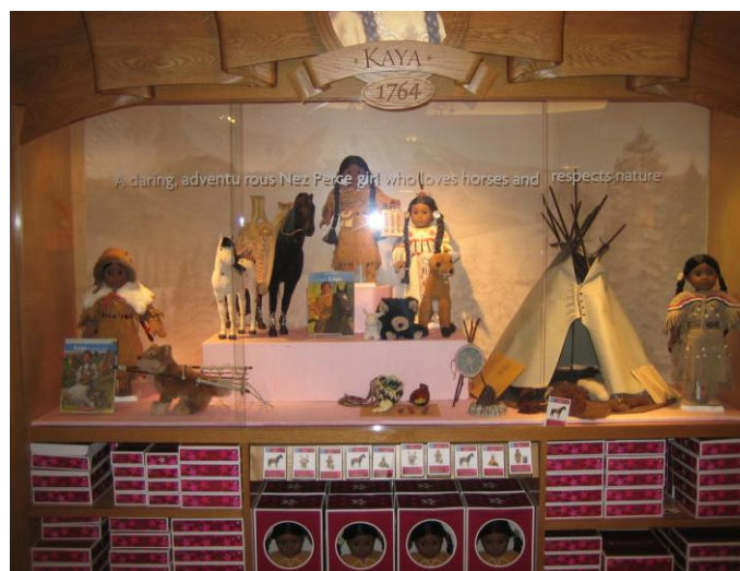
La poupée Nez Percé dans le magasin American Girl de la 5 ème Avenue à New York